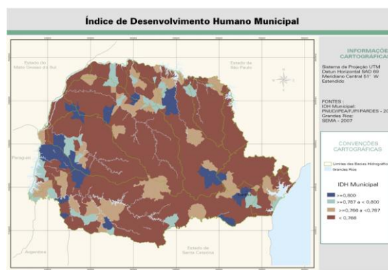
Figura 3 - Índice de Desenvolvimento Humano Municipal

Níveis adotados: para a leitura do indicador (Figura 04), de acordo com níveis de compreensão da informação, e tendo como território de análise as bacias hidrográficas, foram construídos 4 níveis conforme tabela 02.