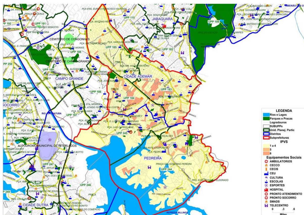
Figura 1 – Subprefeitura de Cidade Ademar, com os distritos Cidade Ademar e Pedreira em destaque.

O Distrito de Pedreira localiza-se na Zona Sul do município de São Paulo. Este distrito possui 18,06 km 2 de área, contando atualmente com uma população de aproximadamente 130000 habitantes (IBGE, Censo Demográfico de 2002). Encontra-se vinculado atualmente à subprefeitura de Cidade Ademar, na qual pertence também o distrito de Cidade Ademar (Figura 1).